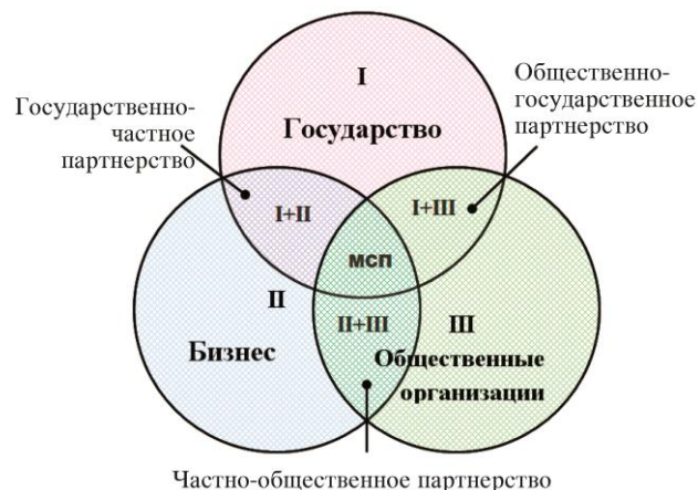
Рис. 1. Практическая реализация межсекторного социального партнерства в Российской Федерации

На основе реализации механизмов межсекторного социального партнерства (МСП) представим различные варианты социального партнерства в России: государственный и муниципальный (I), бизнес-сектор (II) и некоммерческий сектор (III), предусмотрена возможность возникновения как двухсекторных (I и II, I и III, II и III), так и трехсекторных партнерств – I, II, III (рис. 1).