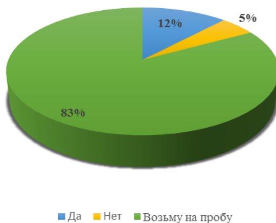
Рис.1. Распределение ответов респондентов на вопрос анкеты «Будете ли Вы покупать вина из камчатского сырья (в частности из ягод камчатской рябины)»

Авторами был проведен социологический опрос потребителей. Около половины респондентов (48%) ответило, что покупают вино в торговой сети г. Петропавловска-Камчатского, причем подавляющее большинство ответило, что покупает вино реже 1 раза в месяц. Среди респондентов, положительно ответивших на вопрос «Покупаете ли Вы вино?», подавляющее большинство (95%) отметили, что будут покупать вино из ягод рябины камчатской или возьмут на пробу. Такие же результаты получены при ответе на вопрос «Будете ли Вы покупать вина из камчатского сырья (в частности из ягод камчатской рябины)?» (рис. 1).