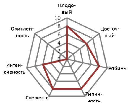
Рис. 5. Профилограмма аромата вина из ягод рябины бузинолистной