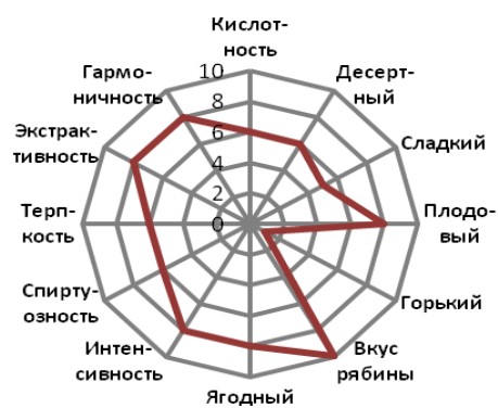
Рис. 6. Профилограмма вкуса вина из ягод рябины бузинолистной