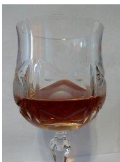
Рис. 3. Внешний вид вина из ягод рябины бузинолистной

Исходя из вышесказанного, органолептическую оценку вина из ягод рябины бузинолистной (рис. 3) с целью максимальной объективности проводили двумя способами: профильным методом и описательным (табл. 1). Была разработана 10-балльная шкала для оценки органолептических показателей профильным методом (табл. 2). Результаты органолептических исследований с помощью профилограмм приведены на рис. 4–6.