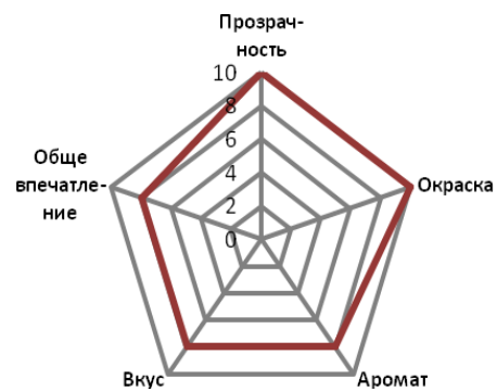
Рис. 4. Профилограмма органолептических показателей вина из ягод рябины бузинолистной