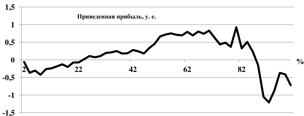
Рис. 4. Зависимость прибыли в пересчете на каждый автомобиль, доехавший с минимальным простоем на КПП таможни (у. е.) от степени заполнения контейнера (%) 3 Источник: составлено автором

На рис. 4 представлена визуализация параметра «приведенная прибыль» в зависимости от процента загрузки контейнера.