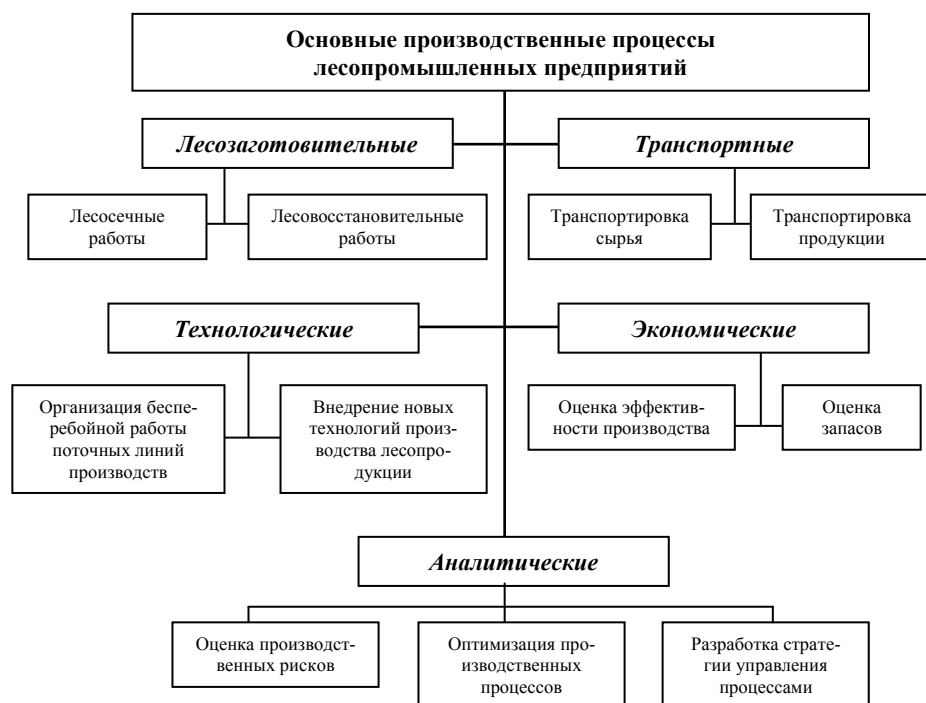
Рис. 1. Укрупненная схема основных производственных процессов предприятия лесной промышленности

Любое производственное предприятие стремится увеличить объем производства и расширить рынки сбыта произведенной продукции за счет совершенствования технологических процессов, что позволит получить дополнительную прибыль [5, 6, 7]. На лесопромышленных предприятиях основным производственным процессом является получение товарной продукции из различных видов древесного сырья. Укрупненная схема основных производственных процессов предприятия лесной промышленности представлена на рис. 1.