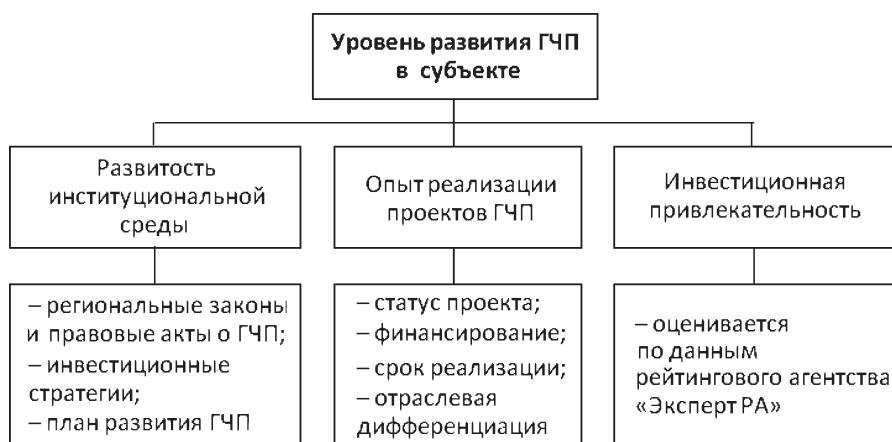
Рис. 2. Схема методики комплексной оценки уровня развития ГЧП в регионах России (составлено авторами с использованием [10])

В настоящее время для оценки эффективности деятельности ГЧП в субъектах Российской Федерации существует методика комплексной оценки уровня развития ГЧП (рис. 2).